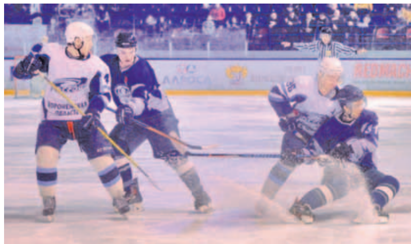
БОРЬБА. Обе команды сражались достойно, но победу одержали дмитровчане.

В ¼ финала ЖК «Дмитров» сыграет с ярославской командой «Локо-Юниор». Первые матчи серии состоятся в Дмитрове 18 и 19 марта, начало в 13.00. В других четвертьфиналах встречаются: «Дизелист» (Пенза) – «СКА-Карелия» (Кондопога), «Горняк» (Учалы, Башкирия) – «Батыр» (Нефтекамск, Башкирия), «Юниор» (Курган) – «Прогресс» (Глазов, Удмуртия).