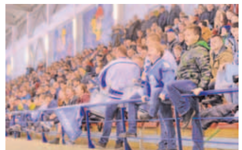
БОЛЕЛЬЩИКИ. При такой мощной поддержке зрителей хозяева площадки не могли проиграть.