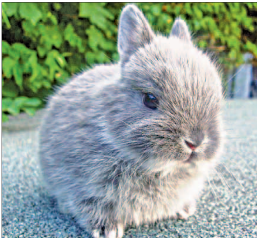
Крольчонок — добрейшее и милейшее существо, которое не доставит в доме больших хлопот.

Домашнее животное. Какого зверька предпочесть, чтобы он доставил меньше проблем и подружился с вашей семьей?