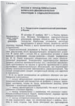
Два взгляда на революцию из современного учебника и учебника времен СССР.