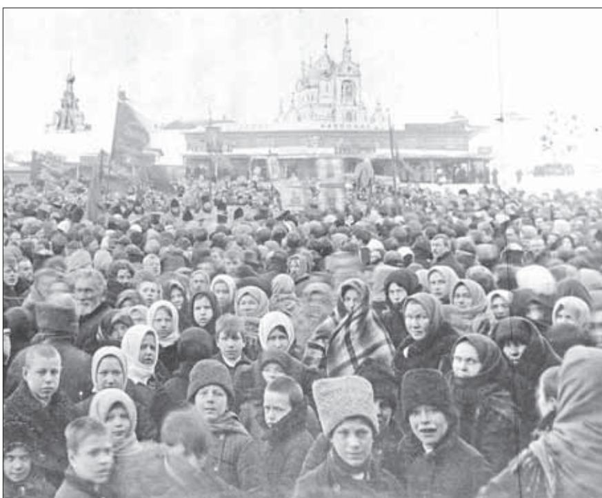
Митинг по случаю революции в Дмитрове, 1917 год.

Дмитров был и остается небольшим провинциальным городом, но тем не менее в нем всегда, как в зеркале, отражаются события, происходящие в нашем государстве. Если мы говорим о событиях Февральской революции, хотя ее точнее было бы называть мартов-