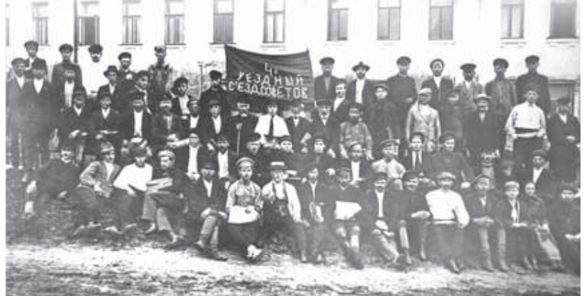
А это уже 1918 год. Делегаты съезда.

10 ноября часть отряда яхромских красногвардейцев была срочно направлена в Москву. Рабочим было поручено нести охрану от Белорусского вокзала до Кремля.